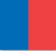
Cantidad de peces escapados entre el 2010 y 2018