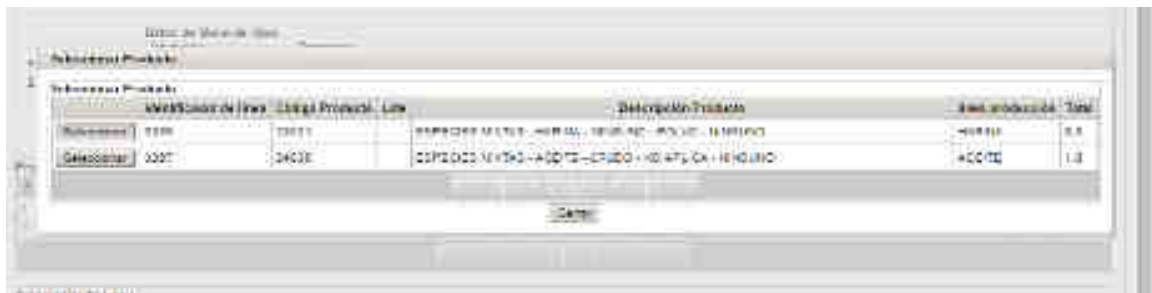
Figura 4. Al seleccionar la declaración para la asignación de lotes sólo mostrará los productos sin lote asignado (1) luego se procede a asignar el lote mediante la selección de algunas de los productos sin lote. Para seleccionar se debe hacer click en la lupa del campo “productos elaborados” (2).