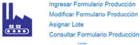
Figura 3. Opción de asignación de lotes posterior a la declaración de producción.

Para ello, en la opción de “Formulario Producción” del módulo de plantas elaboradoras seleccione la opción “Asignar Lotes”.