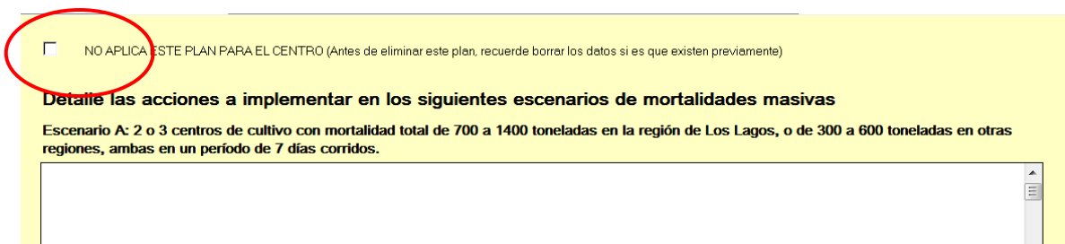
Figura 6.- Casilla para indicar que un plan determinado no aplica al centro de cultivo.

Si existe algún plan de acción ante contingencias que no aplique al grupo, se deberá activar la casilla mostrada en la figura 5, lo que deshabilitará los formularios de ingreso de datos e indicara a su vez que para este centro no corresponde presentar dicho plan (fig. 6).