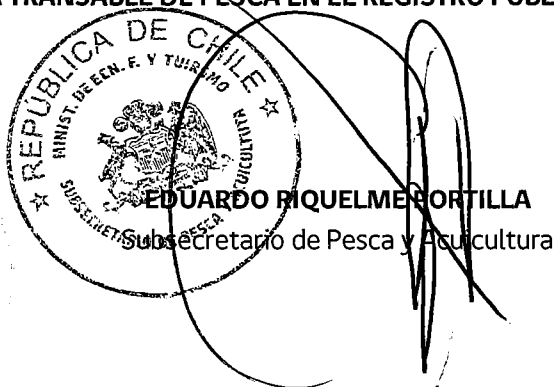
EDUARDO RIQUELME CORTILLA Subsecretario de Pesca y Acuicultura