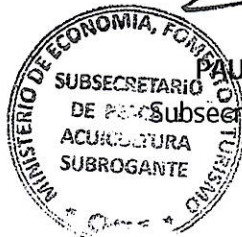
PAULO SEPÚLVEDA SEPÚLVEDA Subsecretario de Pesca y Acuicultura (S)

El texto íntegro del presente decreto se publicará en los sitios de dominio electrónico de la Subsecretaría de Pesca y Acuicultura y del Servicio Nacional de Pesca y Acuicultura.