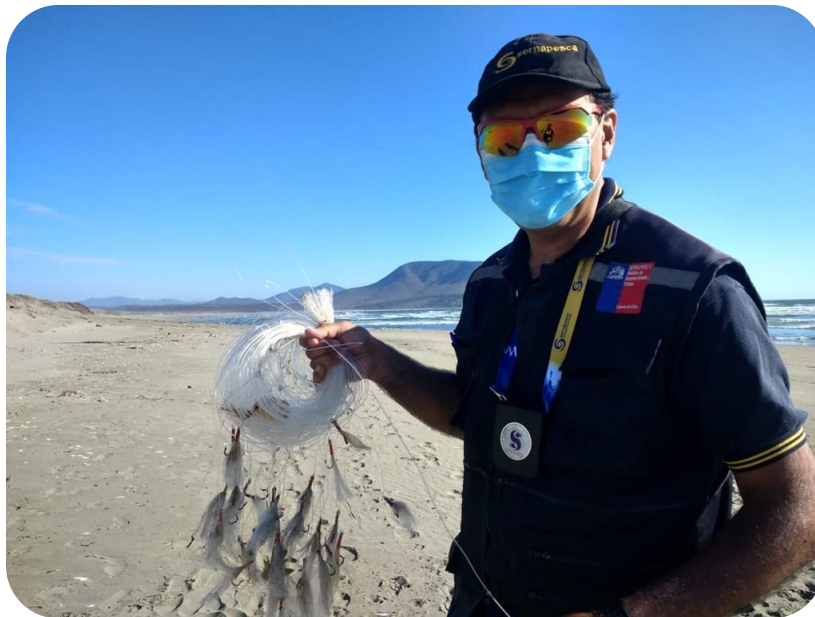
Funcionario retirando espineles