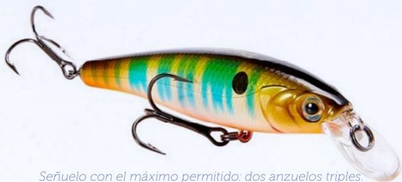
Señuelo con el máximo permitido: dos anzuelos triples.

Señuelo artificial: imitación de alimento natural o excitante, manufacturado, dotado de un máximo de dos (2) anzuelos, sean éstos simples, dobles o triples , cuya operación tiene por objeto la atracción y/o ataque del pez.