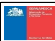
TABLA CALCULO DE CRITERIOS DE EVALUACIÓN ID N° 701-1-LE22 "LICENCIAS PARA EL SERVICIO NACIONAL DE PESCA Y ACUICULTURA"

Versión: 2.5 Páginas: 1 de 1 Fecha: 08-02-2021